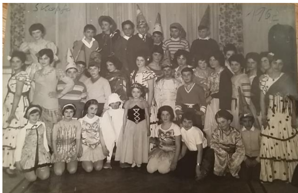
פורים בסקופיה, 1962